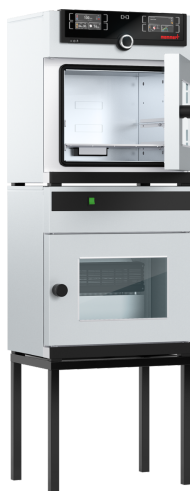
Support optionel pour VO101 (Ref. E02030)

La régulation numérique de la pression garantit un séchage sous vide ultra rapide et tout en douceur, la pompe à vide à débit variable permet d'économiser près de 70 % d'énergie.