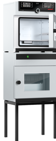
The stand featured on the picture is optional (cat.# E02030)

Digital pressure control ensures rapid and gentle vacuum drying, its speed-controlled vacuum pump (accessory) saves around 70% energy.