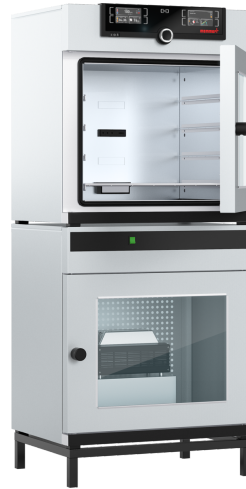
Support optionel pour VO101 (Ref. E02037)

La régulation numérique de la pression garantit un séchage sous vide ultra rapide et tout en douceur, la pompe à vide à débit variable permet d'économiser près de 70 % d'énergie.