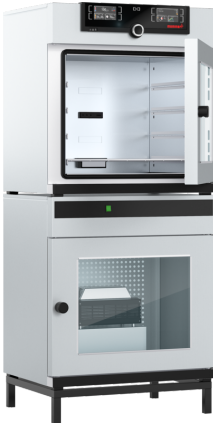
The stand featured on the picture is optional (cat.# E02037)

Digital pressure control ensures rapid and gentle vacuum drying, its speed-controlled vacuum pump (accessory) saves around 70% energy.