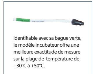
Identifiable avec sa bague verte, le modèle incubateur offre une meilleure exactitude de mesure sur la plage de température de +30^\circ\text{C} à +50^\circ\text{C} .

SPY RF N : \geq à la v1.63 - SPY IP : \geq à la v1.25 - SPY TOUCH N : \geq à la v2.9.5.