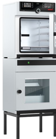
The stand featured on the picture is optional (cat.# E02031)

Digital pressure control ensures rapid and gentle vacuum drying, its speed-controlled vacuum pump (accessory) saves around 70% energy.